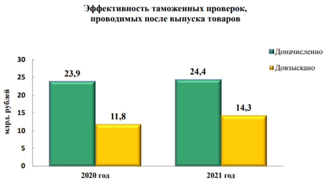
Рисунок 3 – Эффективность таможенных проверок, проводимых после выпуска товаров [3]

В 2021 году было конфисковано товаров на 2,1 млрд. руб., что в 7 раз выше показателя 2020 года (304 млн.руб.). На общую сумму было доначислено платежей на сумму 24,4 млрд. рублей (в 2020 году сумма составляла 23,9 млрд. рублей), включая взаимодействие с Федеральной налоговой службой. При данном анализе следует обратить внимание на высокую эффективность деятельности всего за один год работы.