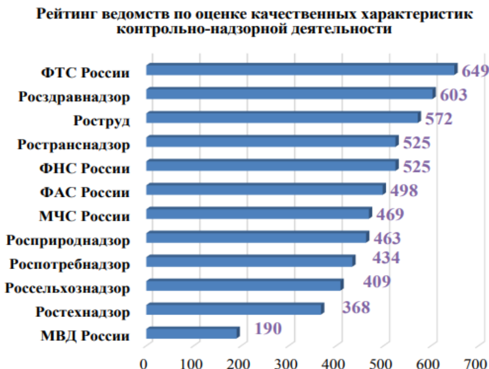
Рисунок 1 – Рейтинг ведомств по оценке качественных характеристик контрольно- надзорной деятельности [3]

При рассмотрении эффективности управления деятельности ФТО (федеральных таможенных органов) следует брать во внимание так называемые «специфические показатели», поскольку они напрямую связаны со спецификой деятельности органов государственной власти, а также деятельности сотрудников (служащих по контракту и государственных гражданских служащих). Одним из примеров «специфического показателя» может выступать предоставление государственных услуг.