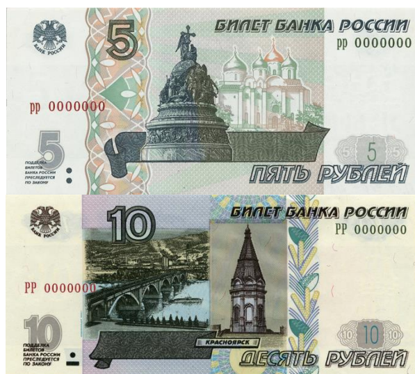
Рисунок 2 – Банкноты 5 и 10 рублей 1997 года.

Источник: официальный сайт ЦБ РФ ( https://www.cbr.ru ).