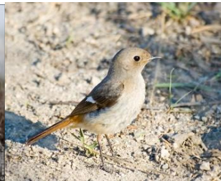
Птенцы горихвостки Взрослая горихвостка

Рассмотрим ситуацию, когда слётки птицы демаскировали и чем это может быть опасно: у птиц имеется маскирующий окрас, который позволяет им сливаться с деревьями, поверхностью земли, но человеческому зрению это мало мешает заметить животное.