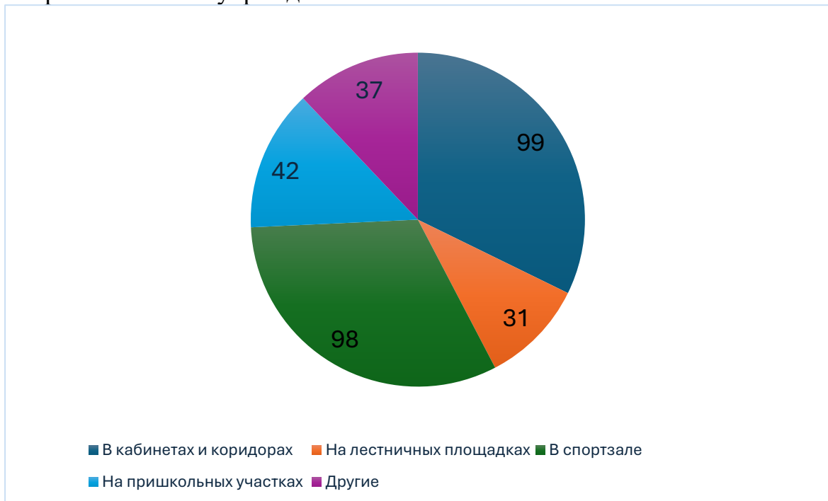
Рисунок 3. Места травмирования детей в образовательных учреждениях Кемеровской области - Кузбасса.

Из муниципальных округов по количеству несчастных случаев с обучающимися лидирует Яшкинский муниципальный округ. В диаграмму нами были включены только те муниципальные образования, количество несчастных случаев в которых было наибольшим. В то же время, согласно своду несчастных случаев [6-11], за исследуемый период не было ни одного несчастного случая в Калтанском, Мариинском и Осинниковском городских округах, а также в Гурьевском, Тяжинском, Чебулинском и Яйском муниципальных округах. Не исключено, что данные муниципалитеты просто не подавали информацию о несчастных случаях в Министерство образования Кемеровской области – Кузбасса, хотя проведённый нами анализ публикаций в сети Интернет не выявил сведений о произошедших в них за исследуемый период чрезвычайных происшествий с несовершеннолетними, находящимися в образовательных учреждениях.