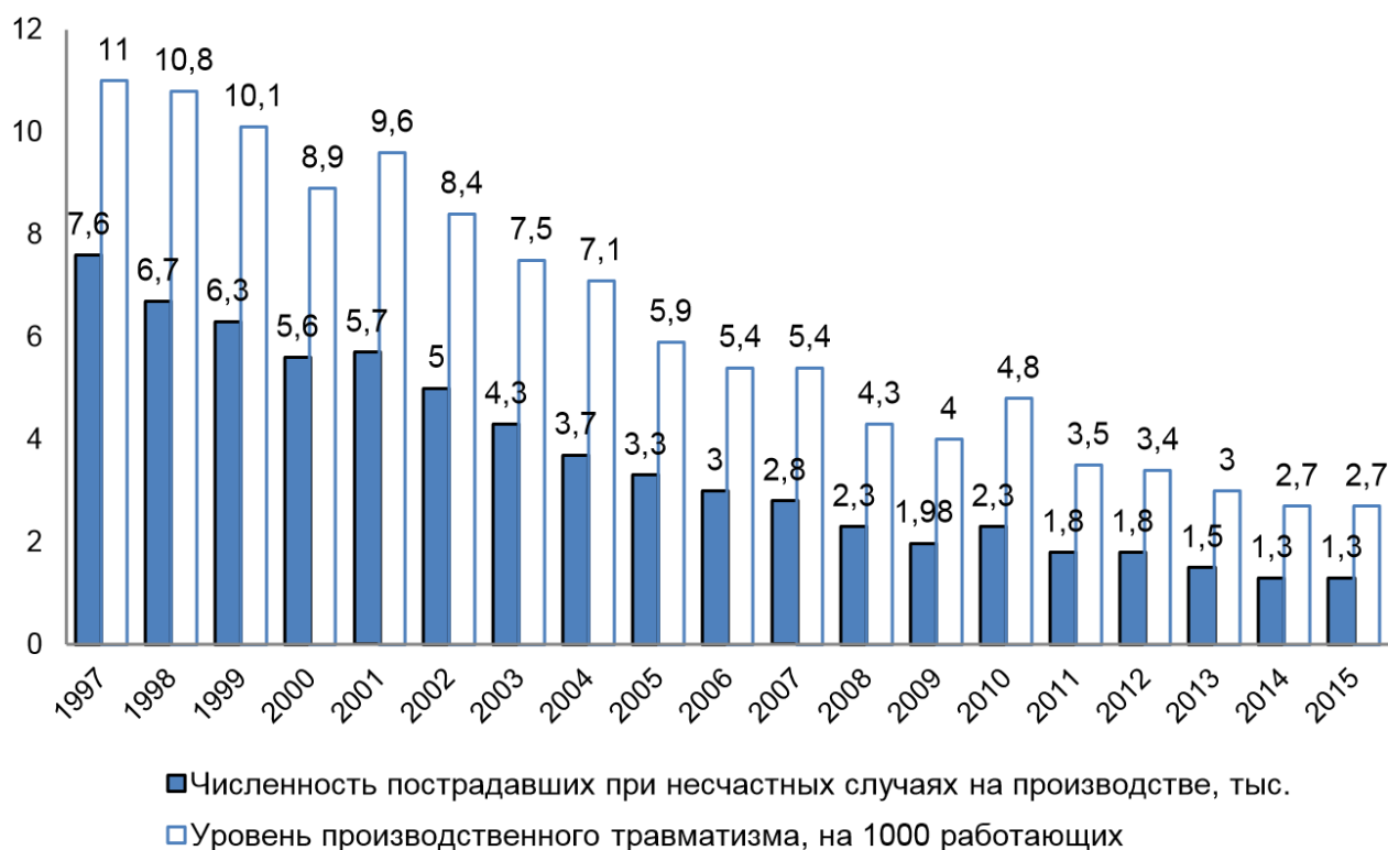
Рисунок 1.2 - Динамика уровня производственного травматизма в Кемеровской области за период с 1997 по 2015 гг.

Анализ данных общероссийского мониторинга условий и охраны труда проводимого Министерством труда и социальной защиты, показал эффективность государственной политики в области ОТ, что прослеживается из тенденции снижения уровня травматизма в РФ, и в частности в Кемеровской области (рисунок 1).