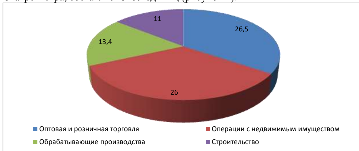
Рисунок 1 – Доля малых предприятий Кузбасса по видам экономической деятельности за 2014 год

В соответствии со статьей 4 Федерального закона от 24.07.2007 № 209-ФЗ «О развитии малого и среднего предпринимательства в Российской Федерации» по состоянию на 01.01.2014г. общее число малых предприятий (без микропредприятий) в Кемеровской области, по данным Статрегистра, составляет 3159 единиц (рисунок 1).