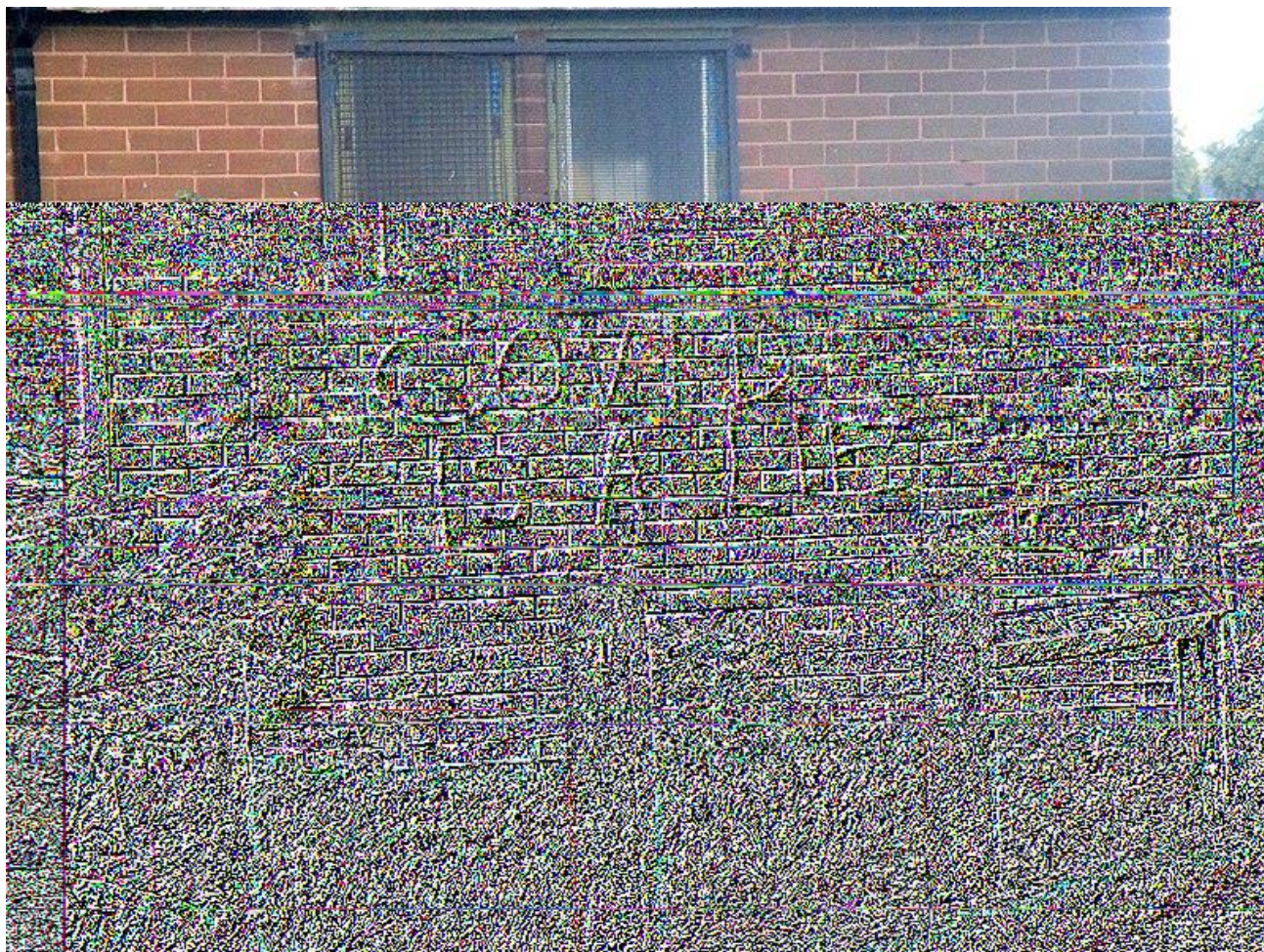
Рис. 1 – граффити «Covid – ложь» в Понтефракте, Западный Йоркшир, Англия. 4 сентября 2020

Причинами того, что человек становится «дениалистом» (начинает отрицать реальность или консенсус), могут быть различные факторы: собственный интерес (финансовый, политический, экономический), религия, даже попытка создать защитный механизм против идей и фактов, которые являются тревожными для человеческого разума. В последнем случае это может происходить, например, из страха, злости или расстройства. Упомянутые эмоции могут быть спровоцированы, если этот самый человек внутренне признаёт факт того, что ситуация реальна, но отказывается верить в это для сохранения своего психологического состояния. Антрополог Дидье Фассен (Didier Fassin) разделяет понятия «отрицание», определенное как «эмпирическая обсервация отклонения реальности и правды», и «дениализм», который определяется им как «идеологическая позиция, при которой человек систематически реагирует отрицанием правды и реальности».