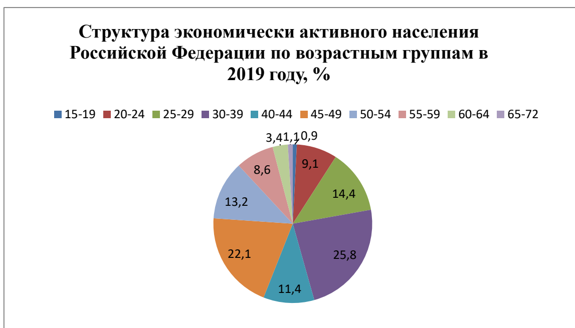
Рисунок 1 – Возрастная структура экономической активности населения страны

Среди экономически активного населения страны (лица в возрасте 15 — 72 лет, которые в рассматриваемый период считаются занятыми или безработными) молодежь занимает около 23% (Рисунок 1).