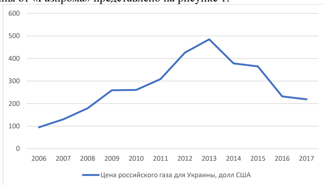
Рисунок 1 – Цена российского газа для Украины, долл. США за 1000 м 3 [4]

Практически сразу после заключения соглашения между бывшими странами-союзниками возникли первые конфликты. Причинами были – цена со стороны России на газ и оплата его поставок. Изменение цен на газ для Украины от «Газпрома» представлено на рисунке 1.