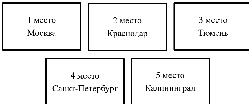
Рисунок 1 – Города лидеры России

Приведем результаты рейтинга устойчивого развития городов РФ за 2019 год. Города-лидеры представлены на рисунке 1 и 2.