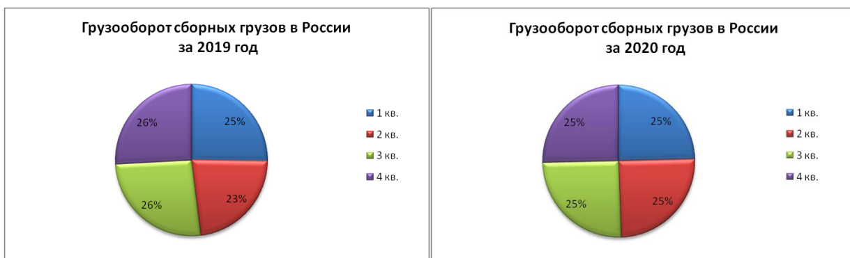
Рисунок 1 – Поквартальная структура грузооборота сборных грузов в Российской Федерации

Графически изменение грузооборота отражено на рис. 1