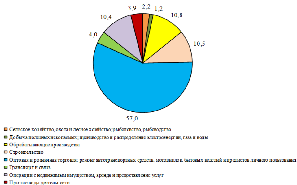
Рисунок 1. Оборот малых предприятий (без микропредприятий) в РФ

Главная особенность малого и среднего предпринимательства – способность к ускоренному освоению инвестиций, высокая оборачиваемость оборотных средств, активная инновационная деятельность. Помимо этого, такому бизнесу свойственны: относительно низкая доходность, высокая интенсивность труда, сложности с внедрением новых технологий, ограниченность собственных ресурсов и повышенный риск в острой конкурентной борьбе. Предприятия малого и среднего предпринимательства – главный источник инноваций, который помогает экономике региона развиваться. Оборот малых предприятий (без микропредприятий) в России по видам экономической деятельности в 2014 г. (в % к итогу), представлен на рисунке 1 [2].